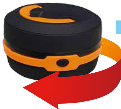
本体の下側を時計回りに軽く回します。