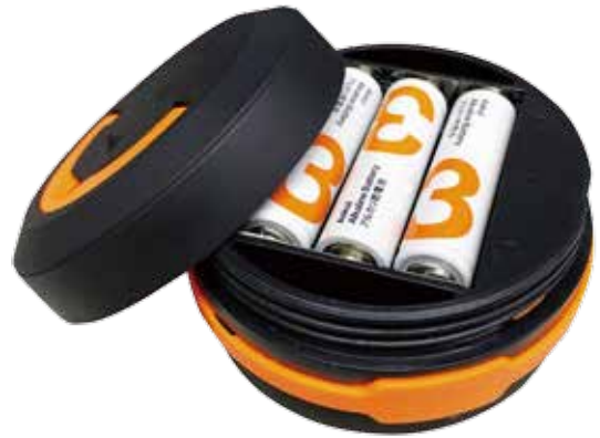
蓋をはずして乾電池を入れ、蓋を締めます