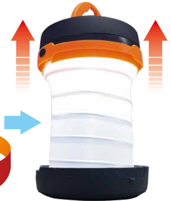
バネの力でひろがりますので、注意しながら広げてください