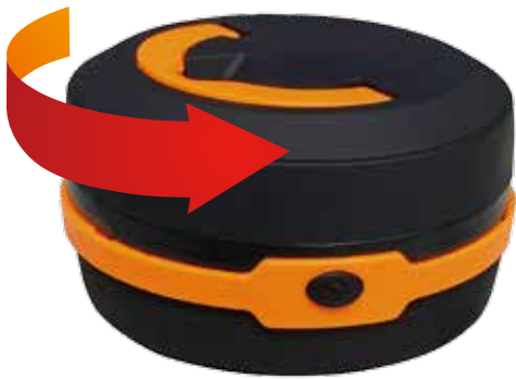
本体の上蓋を反時計回りに回します。

本製品は単三乾電池を3本(別売り)使用します。電池は新しいものと古いものを混ぜて使用したり、分解したりしないでください。本製品を長期間使用しないときは、電池を取り出しておいてください。液漏れや故障の原因になります。